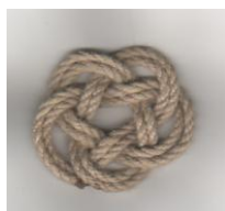
BONNET TURC 5G/3S

Différence entre les BONNETS TURCS, les BADERNES E et les PITONS